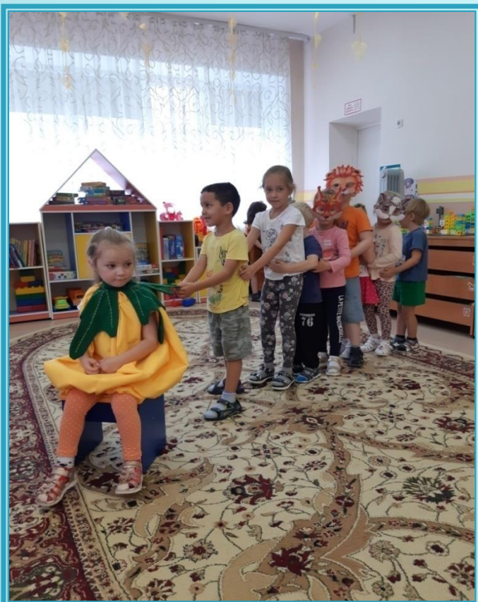
Инсценировка сказки «Репка» на новый лад.