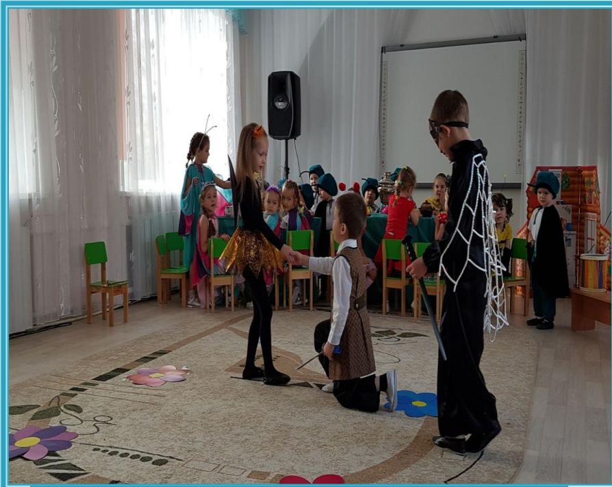
Спектакль «Муха-цокотуха» ребята решили показать в музыкальном зале