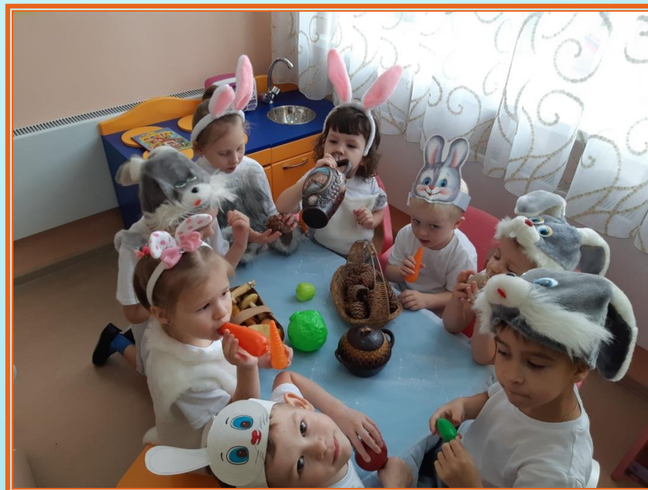
А сказку «Мешок яблок» прямо за столом в группе